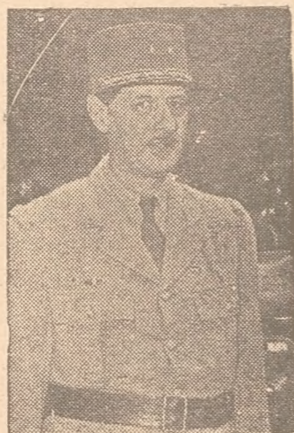
M.R.P. 66k tegen De Gaulle.

In een motie op de partijraad van de M.R.P. nam men het be-